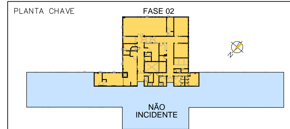
PLANTA FASE – FASE 2 ESCALA: 1:75

NOTA: HAVERÁ FORRO ACARTONADO, GYPSUM ESTRUTURADO TIPO FGE, ESP. 12,5mm, COM TABICA DE 2cm, EM TODOS OS AMBIENTES.