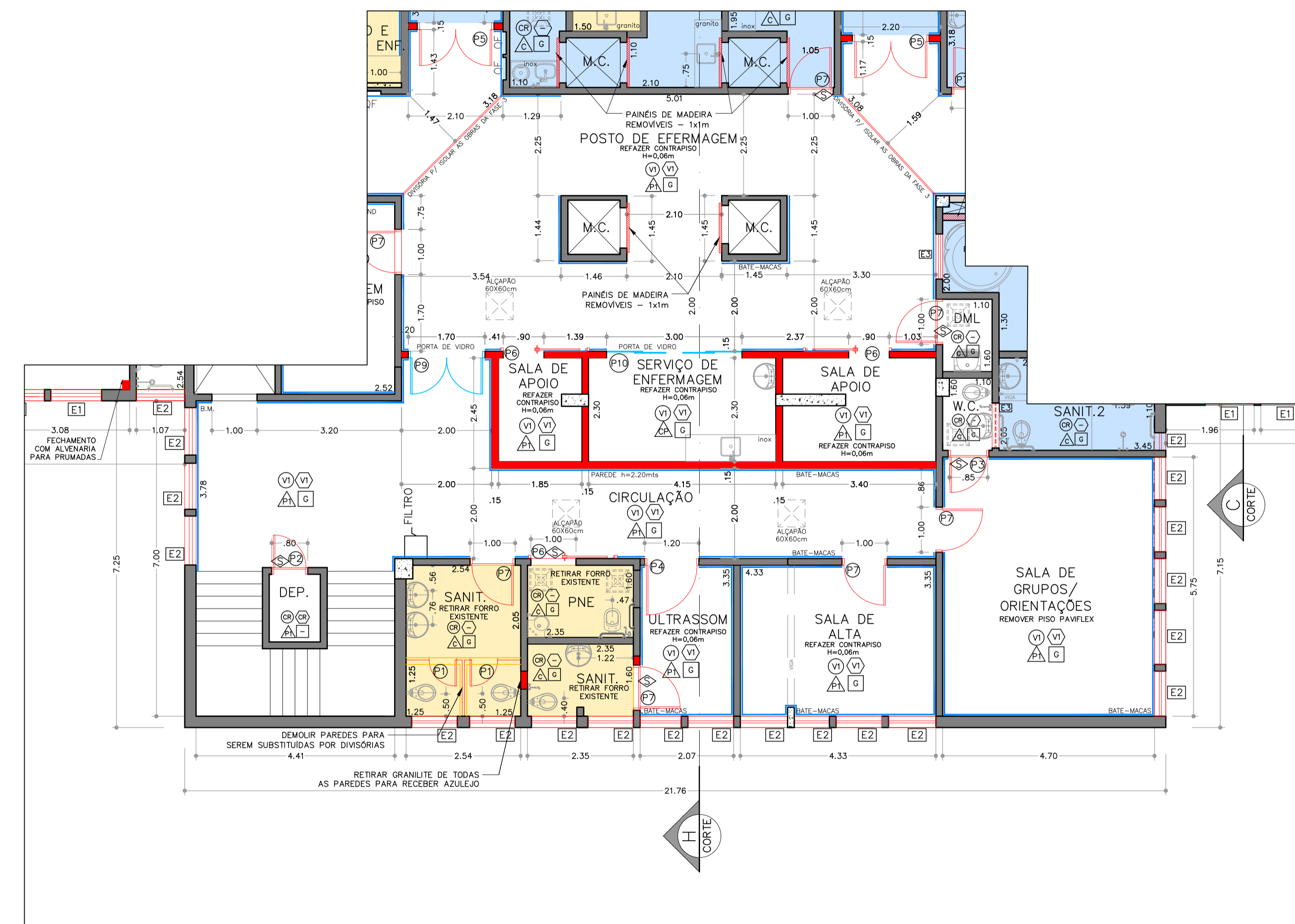
PLANTA BAIXA – SETOR 2 ESCALA:1:75