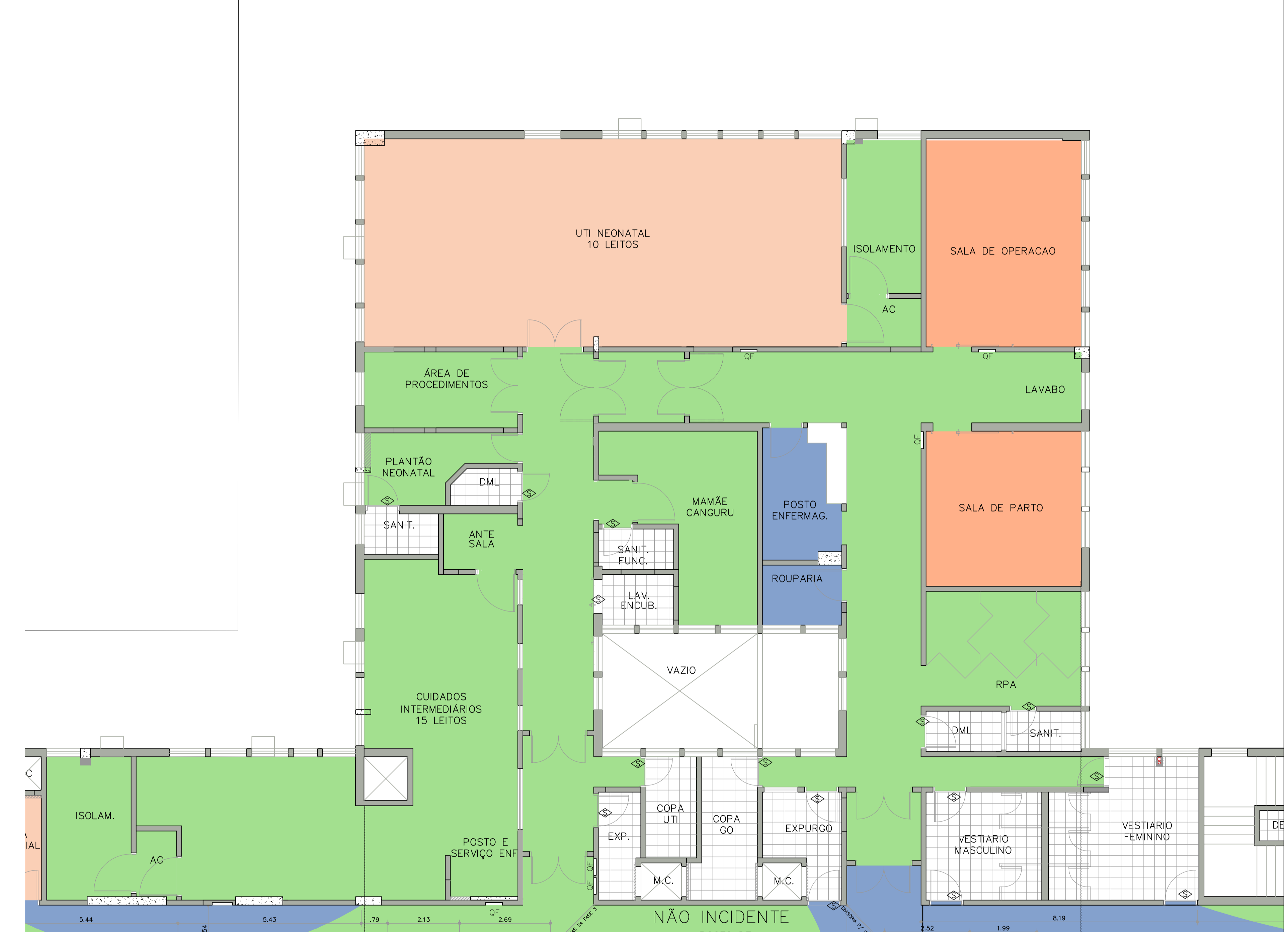
PLANTA BAIXA – FASE 2 ESCALA: 1:75