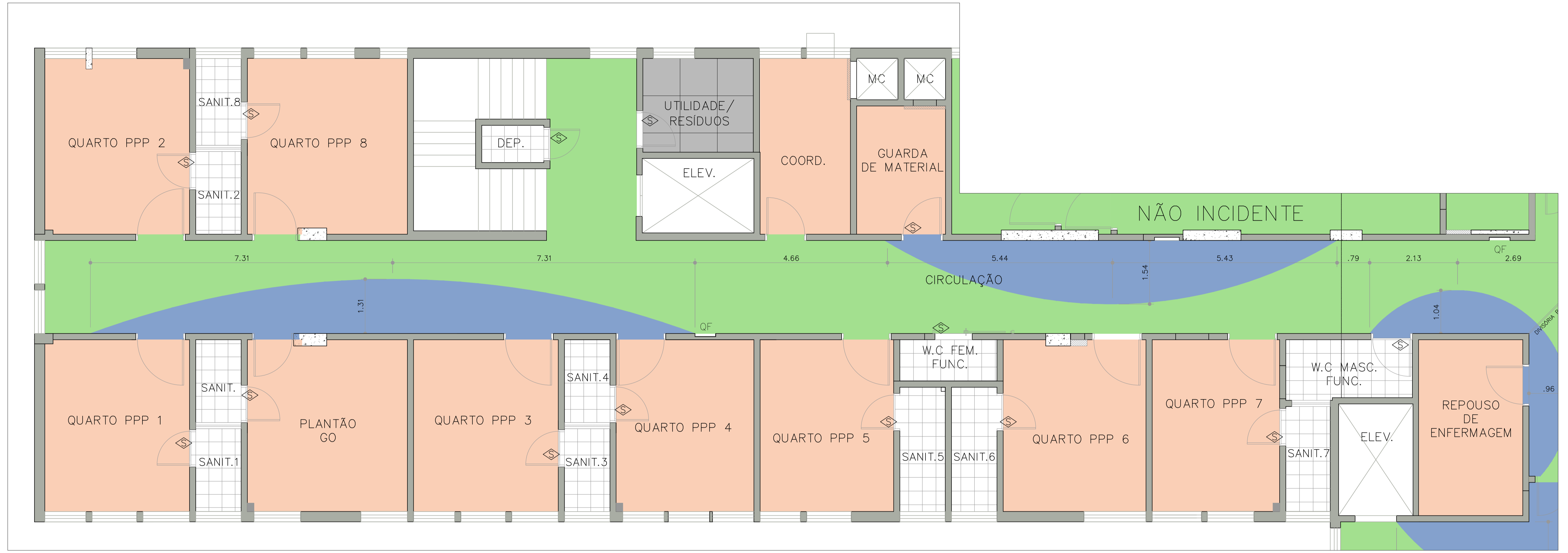
PLANTA BAIXA – SETOR 1 ESCALA: 1:50