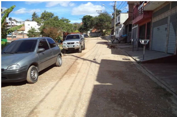
Vista da Rua da Paz próximo a estaca 4, com direção a estaca anterior.