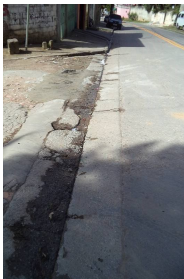
Sarjetão existente entre as Ruas da Paz e Rubens Nunes Campos.