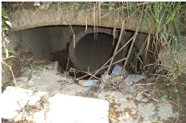
Boca de lobo e tubulação existentes na Rua Sem Nome.