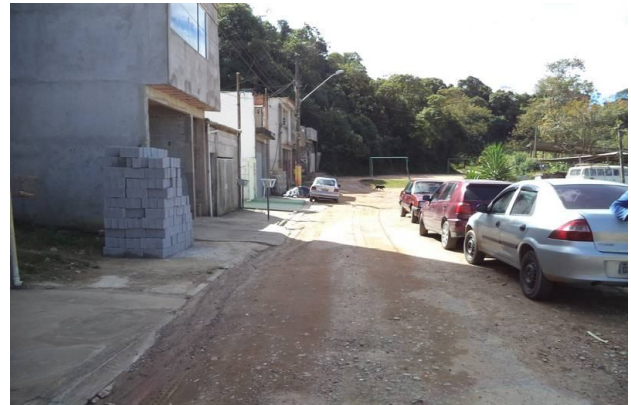
Vista da Rua da Paz próximo a estaca 4, com direção a próxima estaca.