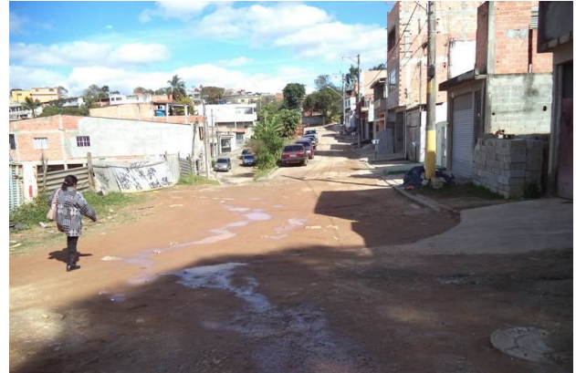
Vista das ruas próxima a estaca 7 da Rua da Paz.