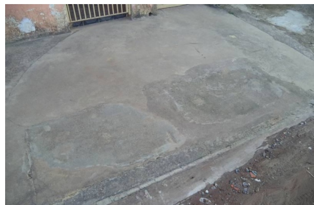
Boca de lobo lacrada na Rua da Paz.