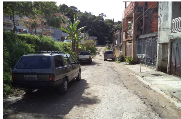
Vista da Rua Sem Nome próximo a estaca 3, com direção a próxima estaca.