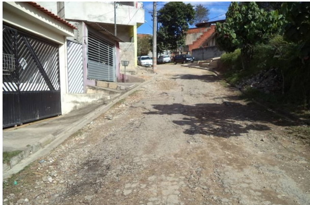
Vista da Rua Sem Nome próximo a estaca 3, com direção a estaca anterior.