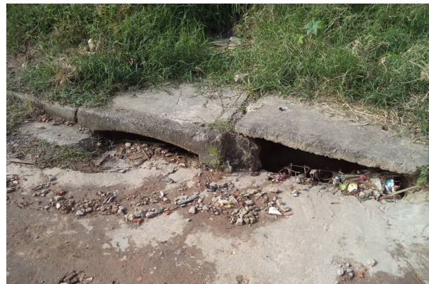
Boca de lobo e tubulação existentes na Rua Sem Nome.