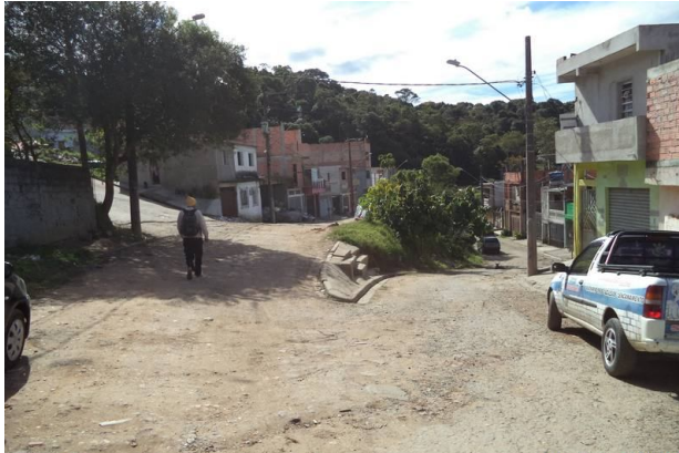
Vista das ruas próxima a estaca 1 da Rua da Paz.