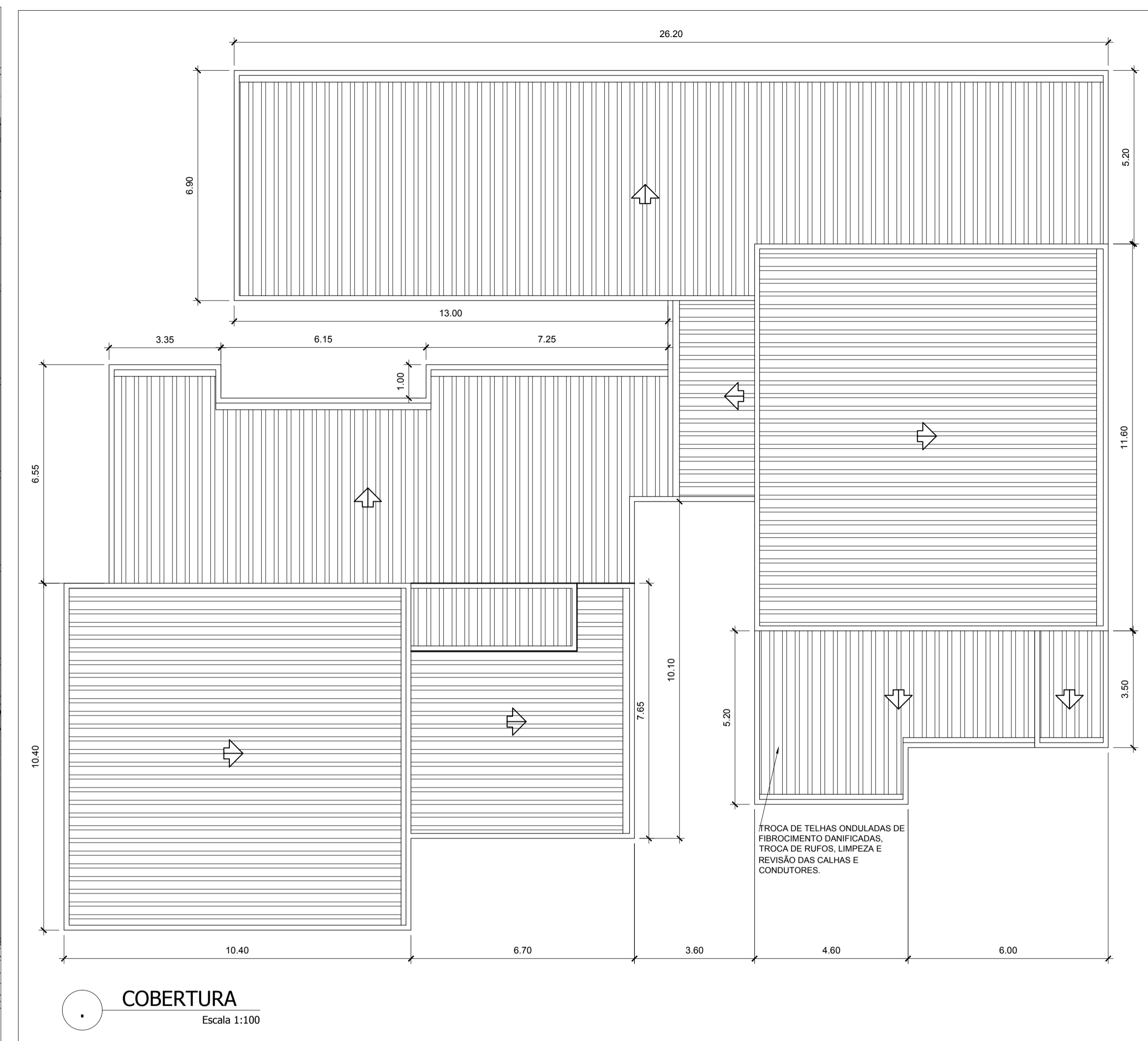
COBERTURA Escala 1:100