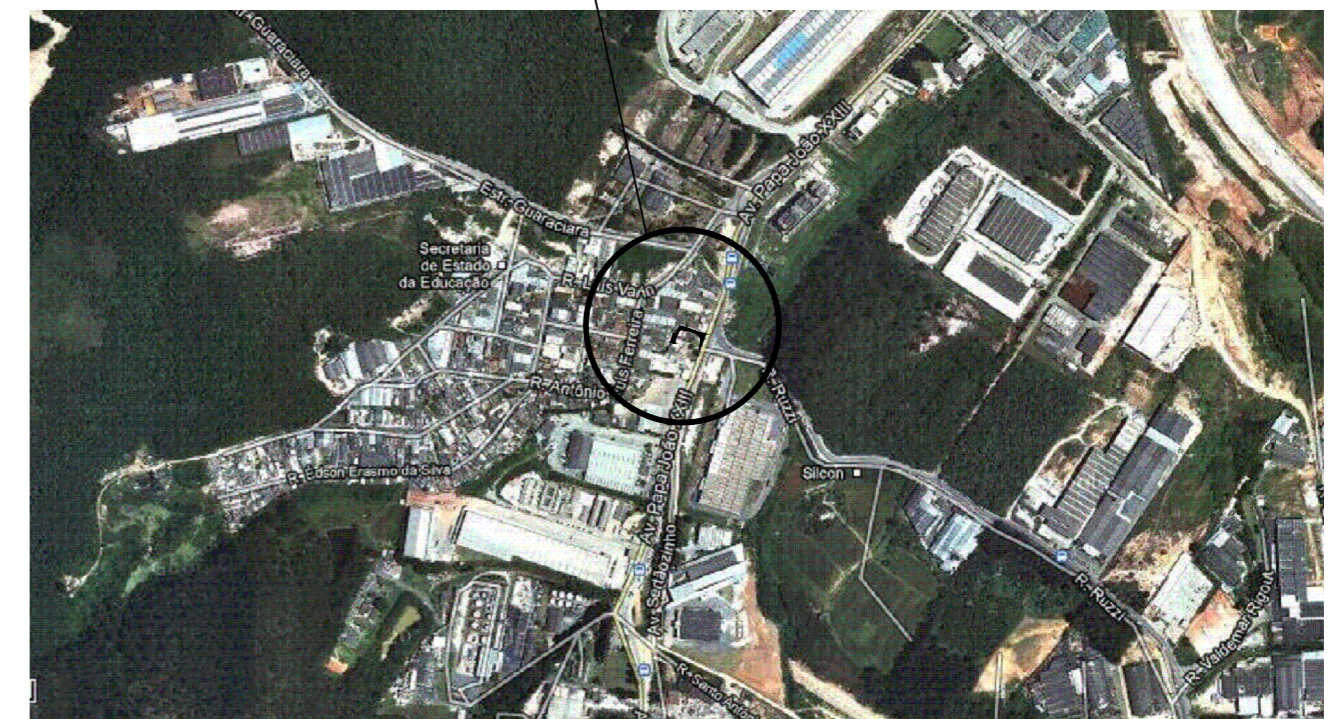
Planta de Localização S/ Escala