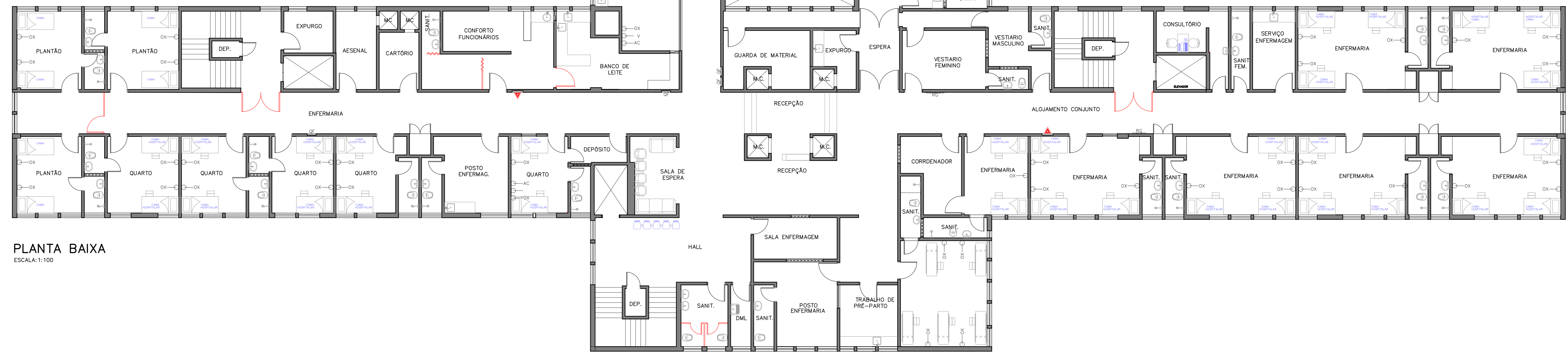
PLANTA BAIXA ESCALA: 1:100