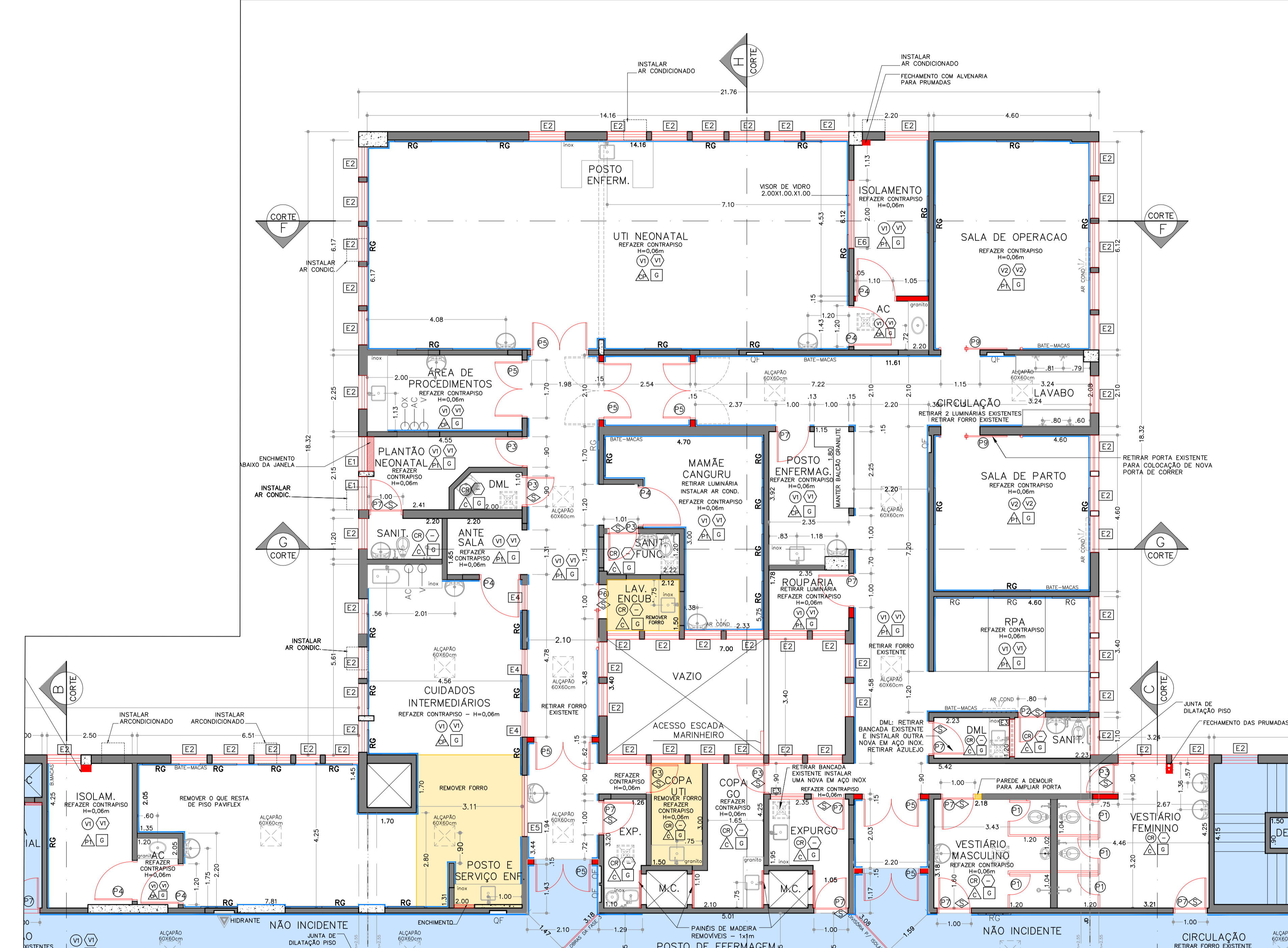
PLANTA BAIXA – FASE 2 ESCALA: 1:75