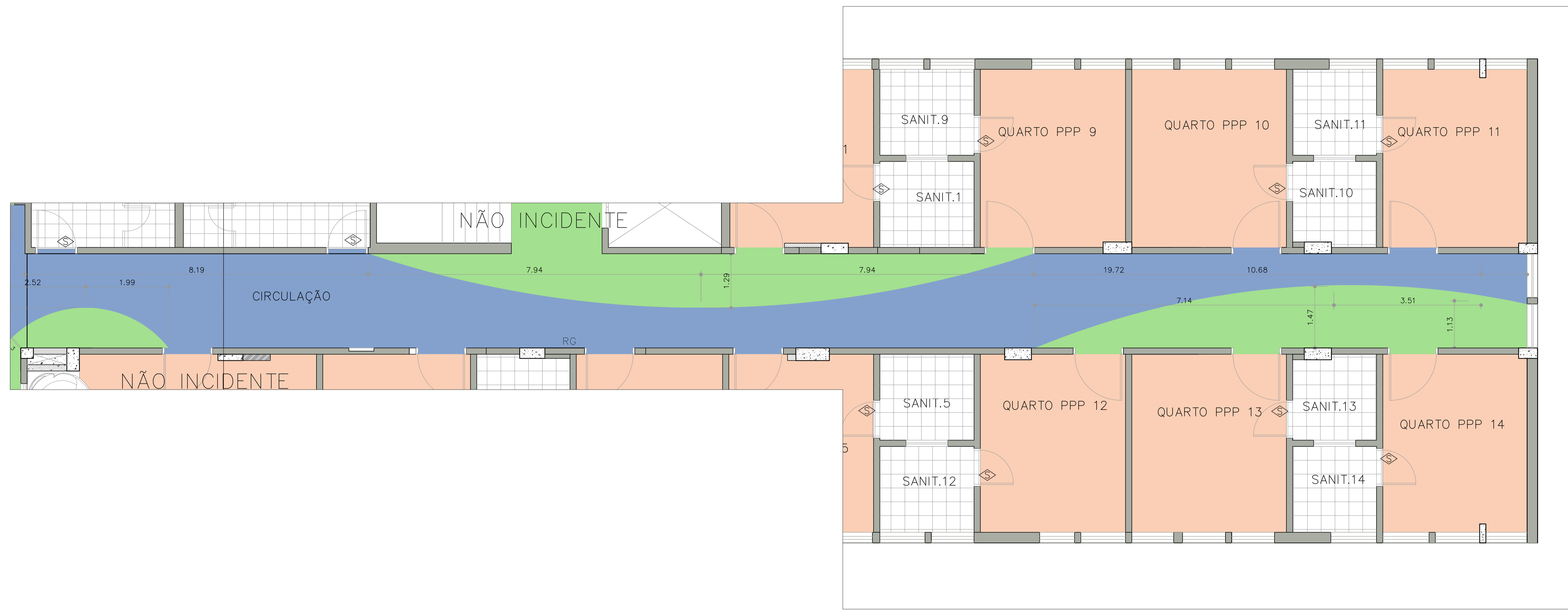
PLANTA BAIXA – SETOR 3 ESCALA: 1:50